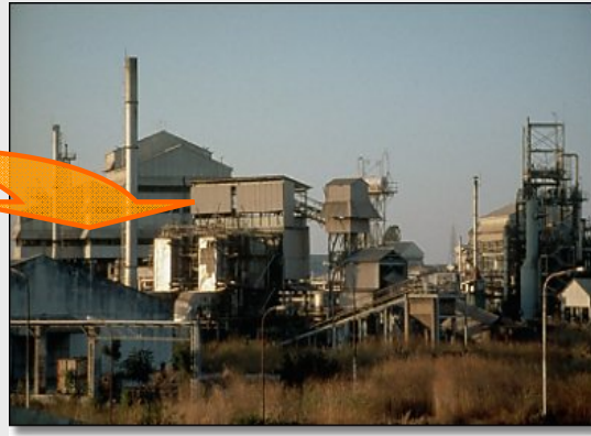
Union Carbide Bhopal Aanleg